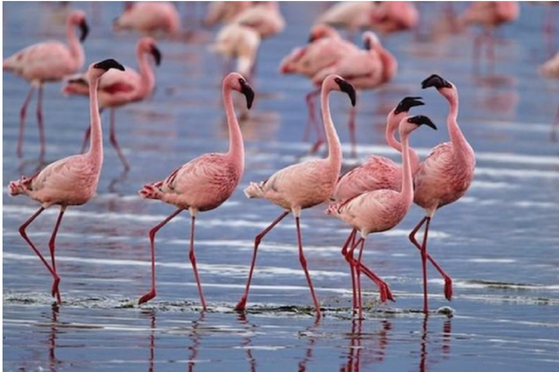
Τα εντυπωσιακά ροζ φλαμίνγκο της Λέσβου