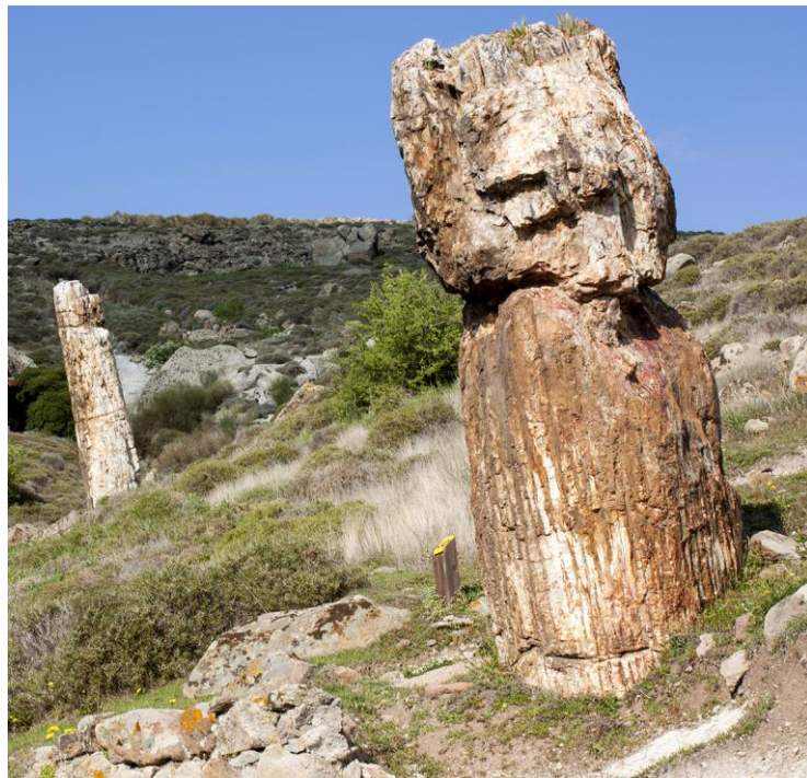
Πάρκο Απολιθωμένου Δάσους