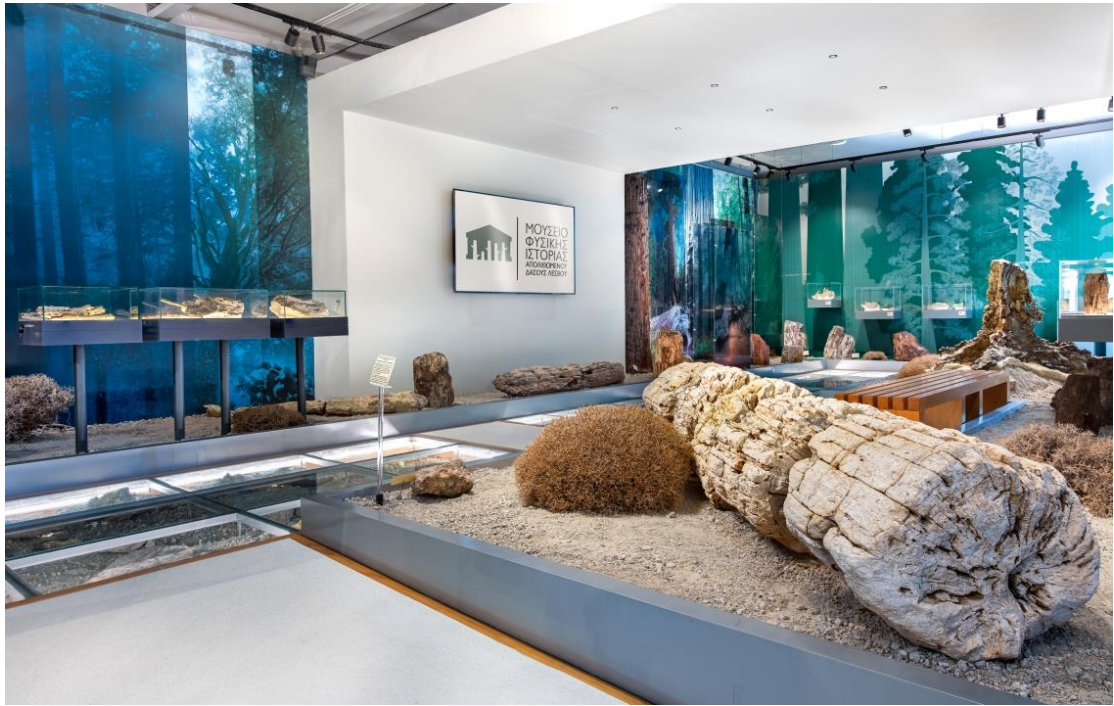
Μουσείο Φυσικής Ιστορίας Απολιθωμένου Δάσους Λέσβου